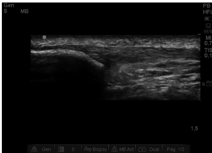
Fig. 3. Imagen hipocóica en polo de rótula.

El programa de estiramientos constaba de un ejercicio de estiramiento para el músculo cuádriceps con tres series de 7 repeticiones dos veces al día (mañana y tarde) realizado en bipedestación, con flexión de rodilla y extensión de cadera, alcanzando el límite de estiramiento sin rebote durante 40-60 segundos.