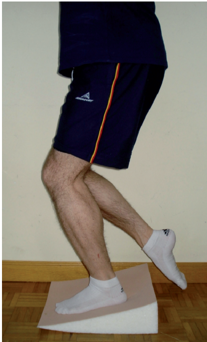
Fig. 2. Ejercicio excéntrico.