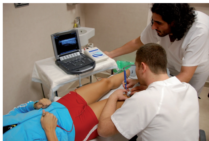
Fig. 1. Aplicación de EPI® ecoguiada sobre el tendón rotuliano.

Se aplicó como tratamiento la electrólisis percutánea intratisular (EPI®) de forma aislada en cada sesión asociada con carácter domiciliario a un programa de trabajo excén-